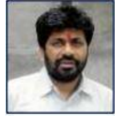
محترم اوم پرکاش عرف پچو باراؤ کڈو راجیہ منتری شعبہ اسکولی تعلیم ریاست مہاراشٹر