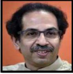
محترم اڈھوجی ٹھاکرے وزیر اعلیٰ ریاست مہاراشٹر