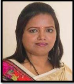
پروفیسر ورشانتانی گائیکواڈ وزیر برائے اسکولی تعلیم ریاست مہاراشٹر