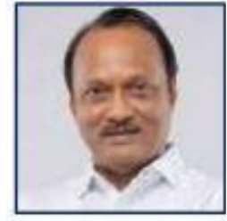
محترم اجیت جی پوار نائب وزیر اعلیٰ ریاست مہاراشٹر