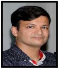
محترم وشال سولنکی (IAS) کمشنر (تعلیم) ریاست مہاراشٹر