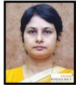
محترمہ وندنا کرشنا (IAS) چیف ایڈیشنل سیکریٹری شعبہ اسکولی تعلیمی و کھیل ریاست مہاراشٹر