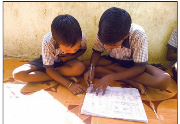
मूल्यवर्धन उपक्रमात विद्यार्थी जोडी चर्चेतून शिकत आहेत