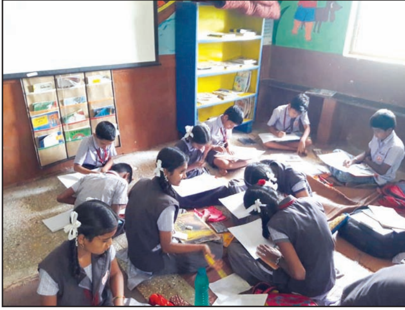
वर्गात मुले शिक्षण घेताना शिस्तीचे पालन करतात.

यानंतर 'राजूचे वेळापत्रक' या मूल्यवर्धन उपक्रमाच्या आधारे मुलांनी स्वतःचे वेळापत्रक तयार केले. शिक्षकांकडून सतत मूल्यांकन आणि निरीक्षण केल्यामुळे बहुतेक मुलांना जेव्हा त्यांचे पालन करण्यास सुरुवात केली तेव्हा त्यांनी अभ्यासासाठी