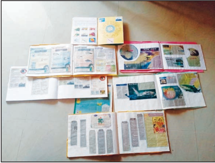
अतिरिक्त वेळेत वृत्तपत्राच्या कात्रणांतून मुले अशी संदर्भ पुस्तके तयार करतात.