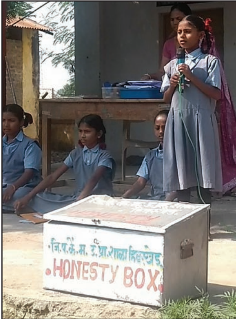
मुलांच्या कल्पनेतून निर्माण झालेला 'ऑनेस्टी बॉक्स'