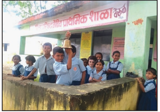
मुलांचे एकत्रित मिसळणे

त्या म्हणतात की, या प्रकारची वागणूक साधारण सगळ्याच शाळांमध्ये असते. त्यामुळे या शाळेत झालेला हा बदल पहिल्या नजरेत कुणाच्याही लक्षात येत नाही. परंतु दोन वर्षापूर्वी या मुलांच्या वागणुकीचे चित्र वेगळेच होते. मुलांमध्ये शिस्त नव्हती. ती शाळेत वेळेवर येत नव्हती. वर्गात हजर असलेली खूप कमी मुले एकमेकांना मदत करित ही मुले आपल्या वस्तू एकमेकांना देत नव्हती.