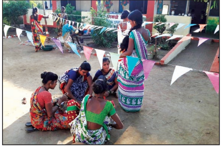
शाळेचा परिसर स्वच्छ झाल्यानंतर तो सजविणाऱ्या महिला