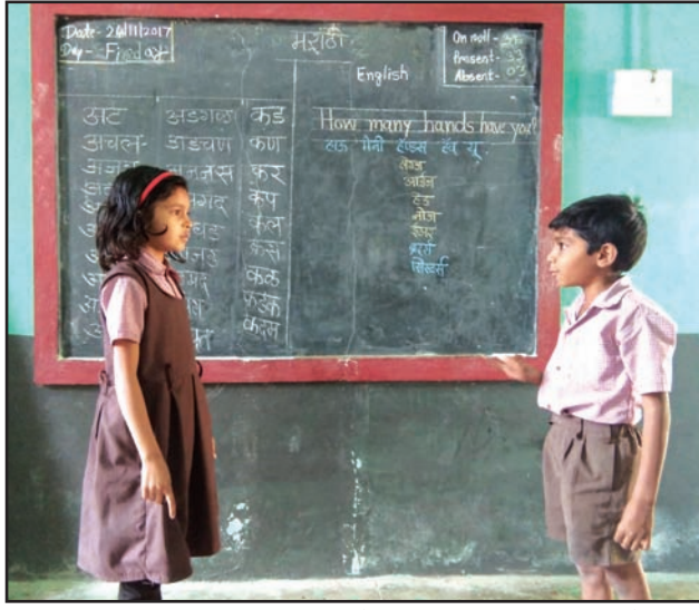
मूल्यवर्धनच्या तासाला एकमेकांशी चर्चा करणारी मुले