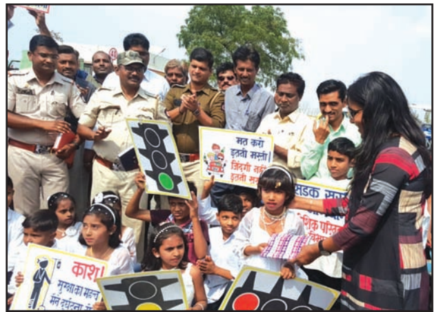
बुलढाणा जिल्हा रस्ता सुरक्षा कार्यालयातील अधिकाऱ्यांच्या हस्ते शाळेतील विद्यार्थ्यांचा सत्कार