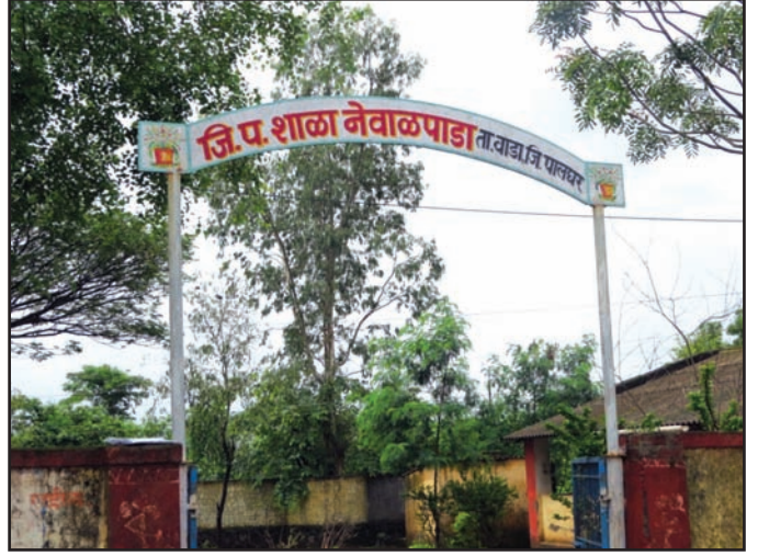
नेवाळपाडा येथील प्राथमिक शाळेचा परिसर

सन २०१८ पासून या शाळेत मूल्यवर्धनचे उपक्रम आयोजित केले जात आहेत. परंतु एकाच वर्षात मूल्यवर्धनच्या शिक्षकाने संपूर्ण गावाला मूल्यवर्धनमधील दैनंदिन व्यवहारांवर आधारित कृती आणि चर्चांमध्ये सहभागी करून घेतले आहे. येथे 'एक दिवस शाळेसाठी' या नावाने एक स्वच्छता उपक्रम चालविला जात आहे. मूल्यवर्धन अंतर्गत होणारी एक कृती म्हणून चालविल्या जाणाऱ्या या कार्यक्रमांमुळे शाळा गावाशी जोडली गेली आहेच पण त्यामुळे गावातील लोकांमध्येही एकजूट निर्माण झाली आहे.