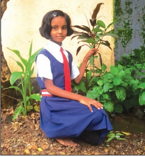
इयत्ता चौथीच्या विद्यार्थिनीने लावली ११ झाडे