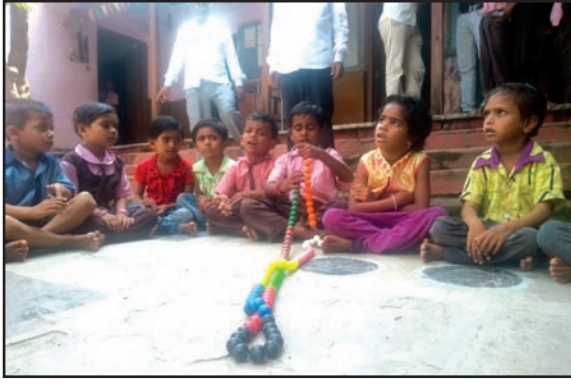
विद्यार्थी खेळातून शिकतात गणित

चित्रे, व्हिडिओ आणि इतर खेळण्यांचा किंवा उपकरणांचा देखील वापर करण्यात येत आहे. यामुळे मुले कठीण प्रश्नही आरामात सोडवू लागले आहेत.