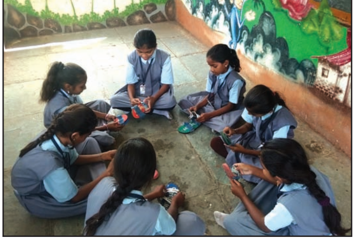
जुन्या चपला दुरुस्त करताना विद्यार्थी