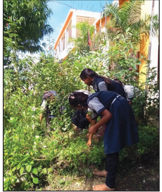
संपूर्ण शाळा पर्यावरणाविषयी जागरूक होत आहे.

यानंतर जेव्हा गावकऱ्यांनी आणखी मदत केली तेव्हा पाण्यासाठी मोठी टाकी आणि विजेची देखील व्यवस्था करण्यात आली. पूर्वी शाळेच्या परिसरात एकही झाड नव्हते; पण आता गावकऱ्यांच्या मदतीने येथे गुलाब, नारळ आणि अशोकासारखी अनेक झाडे पहावयास मिळतात.