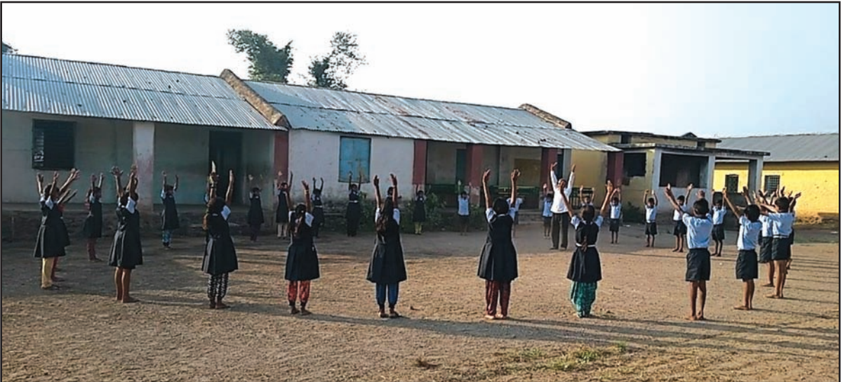
लिंगभेद दूर करण्यासाठी मैदानावर घेतले जाणारे उपक्रम