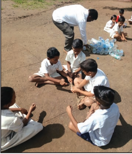
सलाईनच्या नळीद्वारे झाडांना पाणी देण्याची तयारी करताना मुले