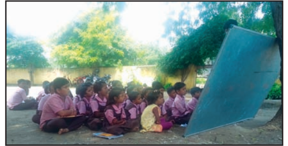
मोकळ्या मैदानात भरतात गणिताचे वर्ग

मूल्यवर्धनमधील शिक्षणाच्या नव्या पद्धतीमुळे फक्त एका वर्षात ही परिस्थिती बदलली आहे. येथील शिक्षकांच्या मते या शाळेची मुले आता गणितात चांगली प्रगती करीत