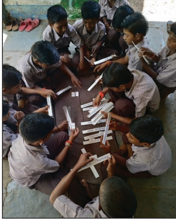
मूल्यवर्धनच्या तासाला कृतीत दंग मुले

भर दिला. या कार्यक्रमासाठी गावातील सगळ्यांना आमंत्रित केले जाते. पालकांनी आणि गावकऱ्यांनी मुलांबरोबर अशा कार्यक्रमांमध्ये भाग घ्यावा आणि शाळेच्या गरजा अधिकाधिक जाणून घ्याव्यात, हा त्यामागे हेतू होता.”