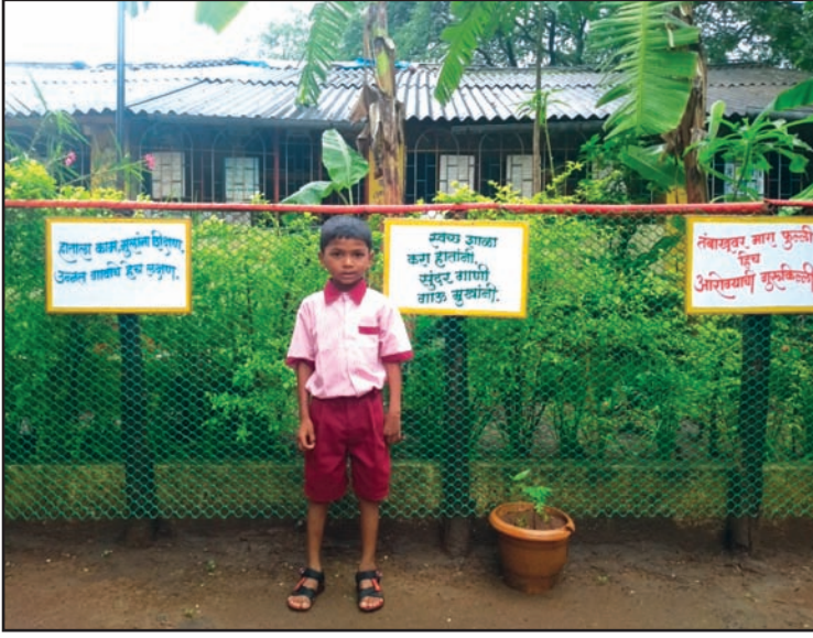
मूल्यवर्धन उपक्रमातून विद्यार्थ्यांनी दिले स्वच्छतेचे संदेश