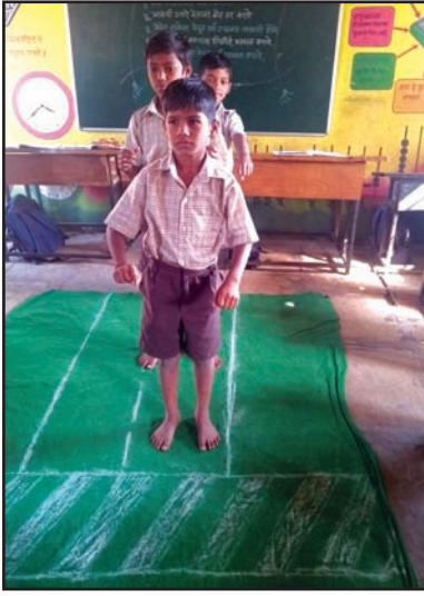
वाहतुकीचे नियम नाटिकेद्वारे सादर करताना विद्यार्थी

कोल्हापूर शहरात कर्मवीर भाऊराव पाटील विद्यामंदिर या शाळेत अशीच एक घटना घडलेली आहे. येथील विद्यार्थ्यांवर मूल्यवर्धनच्या गोष्टींचा एवढा परिणाम झाला की, त्यांनी स्वतःसाठी एक नियम बनविला. हा नियम आहे वेळेत शाळेत पोहोचण्याचा. यासाठी विद्यार्थ्यांनी 'वेळेत शाळेला चाललो आम्ही!' हा एक नारा देखील बनविला आहे. विद्यार्थी आपल्या नियम आणि नाऱ्याचे चांगल्याप्रकारे पालन करून शाळेची एक नवीन ओळख निर्माण करीत आहेत.