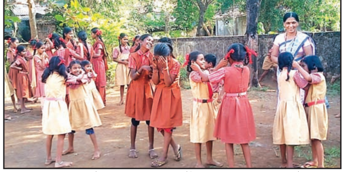
मूल्यवर्धनमुळे अधिकाधिक मुलींचा सहभाग वाढत आहे.

आता मुली येथे शाळेच्या वेळेआधी पोहोचतातच, शिवाय शाळेत नियमित उपस्थित असतात. एवढेच नाही तर, येथे बऱ्याच मुली शाळेच्या व्यवस्थापनातील काही कामांमध्ये हिरिरीने भाग घेत आहेत. मग ती गोष्ट खेळाची असू दे, नाही तर अभ्यासाची; स्वच्छतेची असू देत, नाही तर अभिव्यक्तीच्या कौशल्याची छोट्या मुलांकरिता असणारी आपली जबाबदारी निभाविण्याची असू देत, नाहीतर नेतृत्वक्षमतेची. येथील बऱ्याच मुलींची त्यांच्या वागण्यातून या भागात स्वतःची अशी एक वेगळी ओळख निर्माण होत आहे.