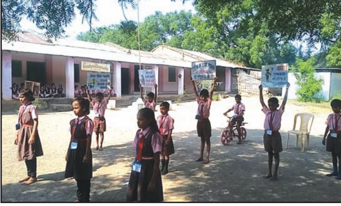
जिल्हा परिषद प्राथमिक शाळेचा परिसर

बुलढाणा शहरापासून ५५ कि.मी. अंतरावर असलेल्या, नांदुरा तालुक्यातील अंबोडा येथील जिल्हा परिषदेच्या मराठी उच्च-प्राथमिक शाळेतील एक शिक्षिका मूल्यवर्धन उपक्रमाने प्रेरित होऊन गेले वर्षभर 'रस्ते आणि वाहतूक सुरक्षा' या मुद्द्यावर जागरूकता मोहीम चालवीत आहेत. त्यांनी गावातील मुलांचे एक कलापथक उभारले आहे. हे कलापथक शहरांतील प्रमुख ठिकाणी जाऊन गीत, संगीत, घोषणा, पोस्टर्स आणि पथनाट्य यांच्याद्वारे वाहतूक नियमांचे पालन करण्याविषयी जागृती करतात. या कार्यक्रमांमधून पथकातील मुले वाहतूक नियमांचा अर्थही सांगतात.