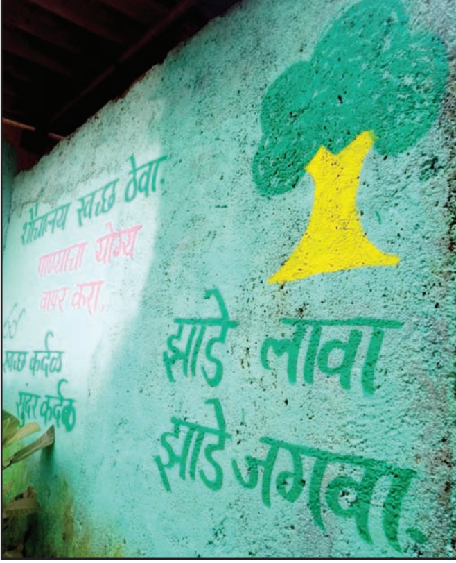
विद्यार्थी आणि समाजाला पर्यावरण जागृतीसाठी मूल्यवर्धनच्या माध्यमातून दिलेला संदेश

प्रदर्शन भरविले. याशिवाय झाडे, रोपे, फुले यांमुळे परिसर हिरवा आणि सुंदर दिसायला लागला आहे.”