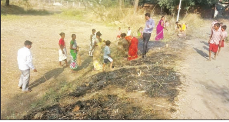
शाळेच्या परिसरात साफसफाई करण्यासाठी एकत्र आलेले गावकरी

शाळेसाठी मोठी भिंत बांधली आहे, पण त्याहून मोठी आणि महत्त्वाची गोष्ट ही की, मूल्यवर्धनमुळे मुलांची भाषा बदलते आहे. ते आता बोलताना असभ्य, अपशब्द वापरत नाहीत. ती ज्येष्ठांचा आदरही करू लागली आहेत."