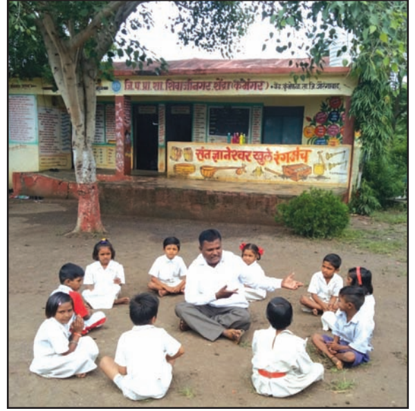
शाळेच्या परिसरातील एक दृश्य

त्या म्हणाल्या, “एक दिवस आम्ही तिसरीच्या वर्गातील मुलांसोबत मूल्यवर्धनच्या तासाला चर्चा घेतली. चर्चेचा विषय होता ‘आपण झाडे कशी वाचवू शकतो?’ या चर्चेत मुलांनी सांगितले की, त्यांना झाडे वाचवायची आहेत पण आपण