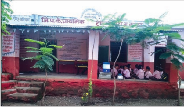
जिल्हा परिषद प्राथमिक शाळा विटा परिसर

औरंगाबादपासून साधारण ६५ किलोमीटर दूर कन्नड तालुक्यातील जिल्हा परिषद प्राथमिक शाळा विटा येथे हीच परिस्थिती होती.