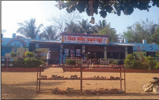
चप्पल-बूट बागेपासून दूर ठेवण्यासाठी केलेली व्यवस्था