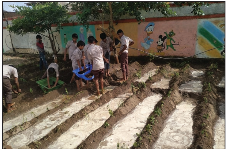
शाळेतील बाग-बगिच्याची साफसफाई करताना विद्यार्थी