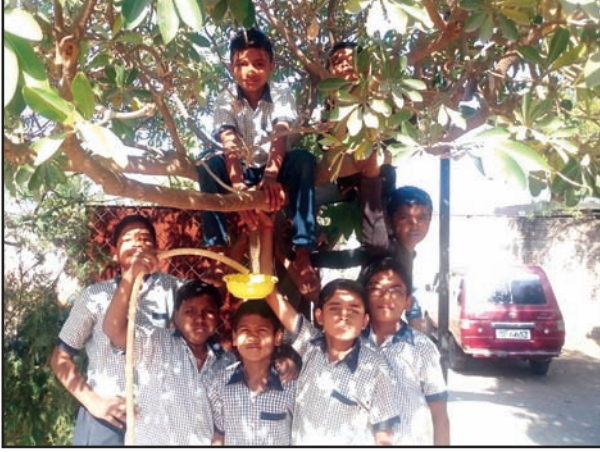
मूल्यवर्धन सहयोगी अध्ययन पद्धतीने बदलले विद्यार्थ्यांचे वर्तन

शिक्षणाची गुणवत्ता वाढविण्यासाठी या शाळेला सर्वाधिक गरज होती ती पुरेशा शिक्षक संख्येची, जेणेकरून शिक्षक प्रत्येक विद्यार्थ्यांवर लक्ष देऊ शकतील. याविषयी शिक्षकांनी सांगितले की, यासाठी सरपंचांनी गावकऱ्यांबरोबर एका बैठकीचे आयोजन केले होते. चांगल्या शिक्षणासाठी चांगले शिक्षक शोधावे लागतील असे यावेळी चर्चेतून समोर आले. यानंतर आजूबाजूच्या गावांतून तीन शिक्षक मिळाले जे पैसे न घेता मुलांना शिकविण्यास तयार होते.