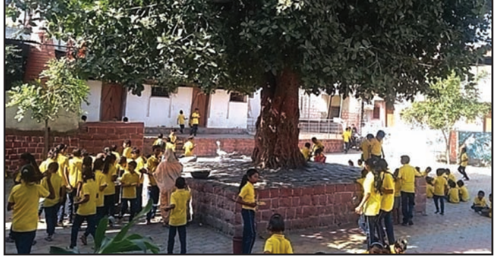
शाळेच्या परिसरातील एक दृश्य

यापूर्वी ही मुलं दिवाळीनंतर शाळा सोडून आपल्या पालकांसह दुसऱ्या गावी जात; परंतु या शाळेच्या प्रयत्नांमुळे गेल्या दोन वर्षांत २० मुलांनी वीटभट्टीवर जाण्यासाठी गाव सोडण्यास नकार दिला. अशा प्रकारे शाळा सोडून जाण्याच्या प्रकाराला आळा बसला. ही मुले नियमितपणे शाळेत हजर राहतील, यासाठी शिक्षकांनी केलेल्या प्रयत्नांना यश आले. शिक्षकांच्या या प्रयत्नांमुळे या मुलांना अभ्यासातही गोडी निर्माण झाली आहे. याबरोबरच त्यांच्यामध्ये आत्मविश्वासही वाढू लागला आहे. ही मुले आता समाजातील इतर मुलांशीही मिसळून वागत आहेत. या मुलांच्या वागणुकीत झालेला बदल पाहून त्यांच्या समाजातील लोकंही आनंद व्यक्त करीत आहेत.