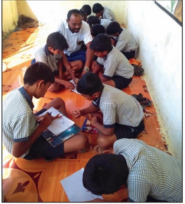
मूल्यवर्धनमधील उपक्रम विद्यार्थ्यांबरोबर करताना शिक्षक

यानंतर गावकऱ्यांनी वर्गणी जमा करून शाळेसाठी काही पैसे आणि जरूरीचे सामान एकत्र केले. काही गावकरी श्रमदानासाठी पुढे आले. अशाप्रकारे या शाळेला सुंदर, सुविधायुक्त आणि डिजिटल बनविण्यासाठी गावकऱ्यांनी शिक्षकांची मदत केली.