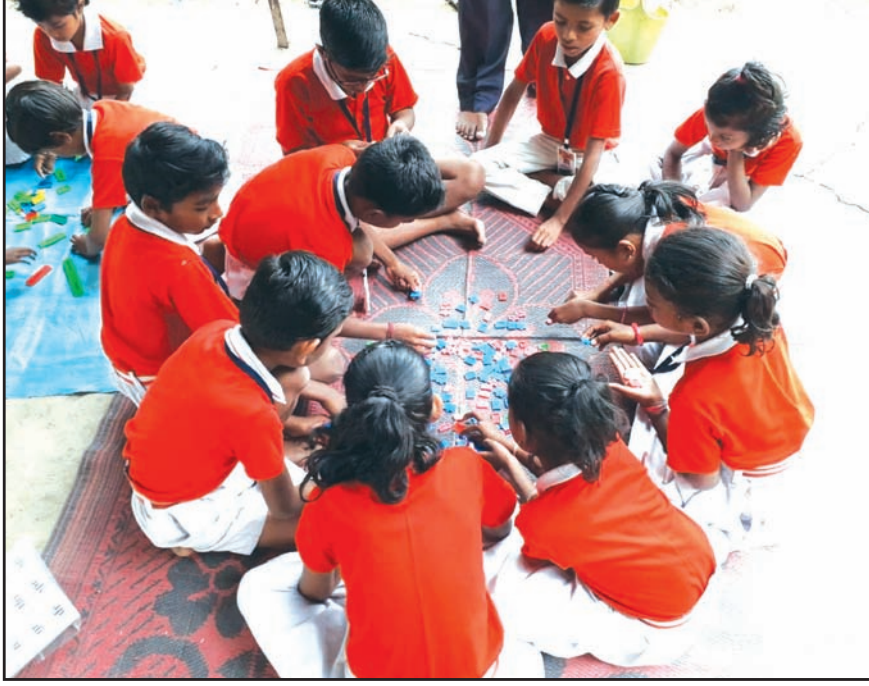
मूल्यवर्धनमधून प्रेरणा घेऊन मुले वाचनालयात पुस्तकांच्या वाचनाबरोबर अभ्यास आणि खेळ देखील गटाने करतात.

तसेच जर एखाद्या मुलाला वाचनालयात एखादे पुस्तक वाचायचे असेल, तर त्यासाठी वेळ निश्चित केलेला आहे. प्रत्येक वर्गासाठी वेगवेगळा वेळ निश्चित केला आहे. उदाहरणार्थ, दुसरी इयत्तेतील मुले दुपारी २ ते ३ च्या दरम्यान वाचनालयाचा लाभ घेऊ शकतात. तथापि, एखाद्या मुलास विशेष परिस्थितीत एखादे पुस्तक वाचायचे असेल तर त्याला आपल्या वर्गशिक्षकांची परवानगी घ्यावी लागते.