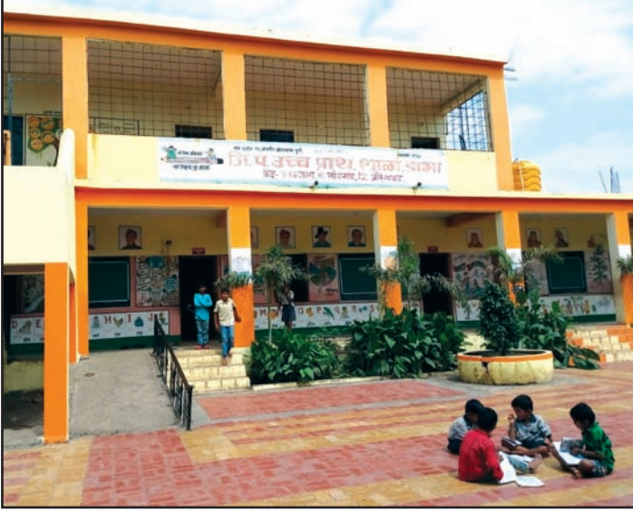
शाळा परिसराचे दृश्य

औरंगाबादपासून जवळपास २०० किलोमीटर दूर दुर्गम भागातील एक शाळा मूल्यवर्धनकडून मिळालेल्या शिकण्याच्या सहयोगी अध्ययन पद्धतीमुळे चर्चेत आहे. ही पद्धत मुलांना इतकी आवडत आहे की ती दररोज २४ किलोमीटर प्रवास करून या शाळेत शिकायला येत आहेत.