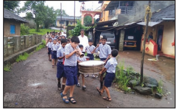
अंधश्रद्धा निर्मूलनासंदर्भात उणेगांव शाळेतील मुलांनी काढलेली जनजागृती फेरी

महत्त्वाची बाब म्हणजे आरोग्य आणि अंधश्रद्धा निर्मूलन या विषयांवर ग्रामस्थांमध्ये जनजागृती करण्यासाठी या शाळेच्या आवारात वेळोवेळी शिबिरे आयोजित केली जातात. शालेय मुले या विषयांवर पथनाट्याचे आयोजन करतात.