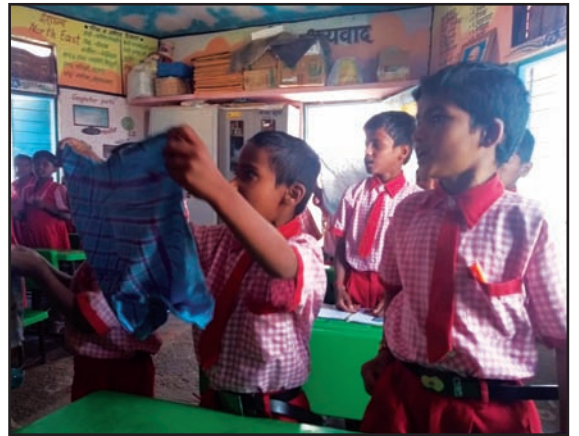
मूल्यवर्धन उपक्रमात सहभागी विद्यार्थी