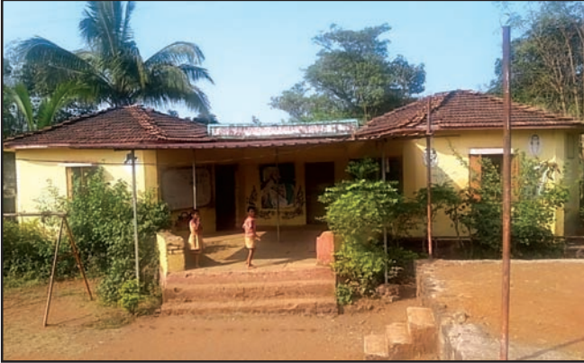
रायगड जिल्हा परिषद मराठी प्राथमिक शाळा दिवीलचा परिसर

जवळपास १००० लोकसंख्या असणाऱ्या दिवील गावामध्ये उच्च आणि मध्यम परिस्थिती असलेली शेतकरी कुटुंबे आहेत. ते धान्य, डाळी आणि तेलबियांचे उत्पादन घेतात. सन १९३२ मध्ये स्थापन झालेल्या या शाळेत एकूण ६२ मुलांमध्ये ३२ मुली आणि ३० मुले आहेत. येथे जून २०१८ पासून मूल्यवर्धनचे उपक्रम आयोजित केले जात आहेत.