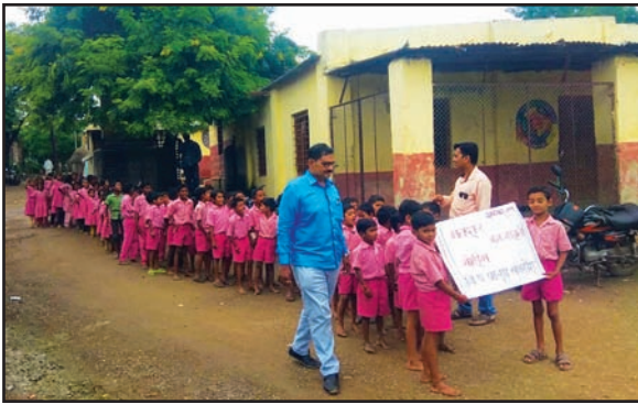
अभ्यासाबरोबरच शाळेतील वेगवेगळे उपक्रम करण्यात मग्न झालेले विद्यार्थी