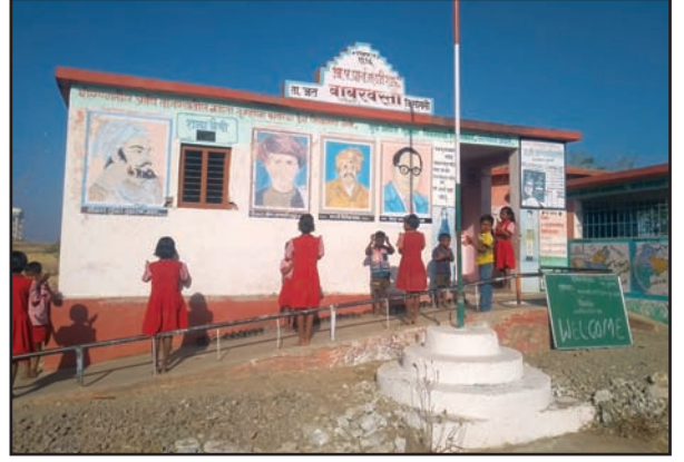
जिल्हा परिषद शाळा बाबरवस्ती शाळेचा परिसर