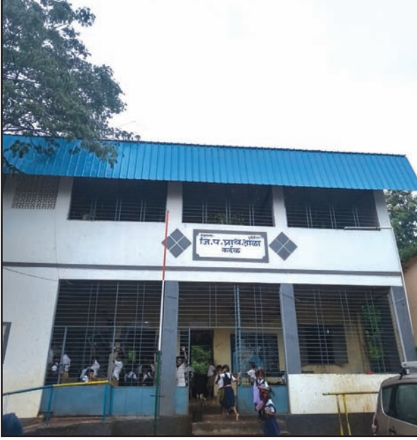
कर्दळ येथील जिल्हा परिषद प्राथमिक शाळेची इमारत

साधारणपणे पर्यावरण शिक्षणासारखे विषय फक्त पुस्तके आणि शाळेच्या चार भिंतींमध्ये अडकून पडलेले दिसतात; परंतु मूल्यवर्धनची बालकेंद्री शिक्षणपद्धती लहान वयापासूनच मुलांना पर्यावरणाला वाचविण्यासाठी आणि पृथ्वीला सजविण्यासाठी प्रेरित करित आहे. पर्यावरणाशी निगडित अनेक गृहकार्ये आणि उपक्रम मुलांबरोबर शिक्षक आणि पालकांचे संबंध ही मजबूत करित आहेत, पण त्याबरोबरच यामुळे संपूर्ण गावदेखील पर्यावरणाबद्दल जागरूक होत आहे. उत्तर कोकण भागातील पालघर जिल्ह्यामध्ये अशीच एक शाळा आहे, जेथे पावसाळ्यात मुले मोठ्यांच्या मदतीने शेतात, मळ्यात, घरी, अंगणात झाडे लावत आहेत.