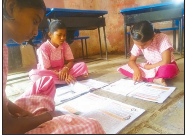
गटात मूल्यवर्धन उपक्रम करताना जिल्हा परिषद प्राथमिक शाळा बनशेंद्रा येथील विद्यार्थी

औरंगाबाद जिल्हा मुख्यालयापासून साधारणतः ५० किलोमीटर दूर असलेल्या कन्नड तालुक्यातील बनशेंद्रा येथील जिल्हा परिषद प्राथमिक शाळा. जवळपास २५०० लोकसंख्या असणाऱ्या या गावात बहुतेक सर्व कुटुंबे शेतकरी किंवा शेतमजूर आहेत. सन १९१४ मध्ये सुरू झालेल्या या मराठी माध्यमाच्या शाळेत एक मुख्याध्यापक आणि सहा शिक्षक आहेत. शाळेत पहिली ते पाचवी मिळून एकूण १४३ विद्यार्थी आहेत. त्यात ८२ मुले आणि ६१ मुली आहेत. येथे फेब्रुवारी २०१९ पासून मूल्यवर्धन कार्यक्रम सुरू झालेला आहे.