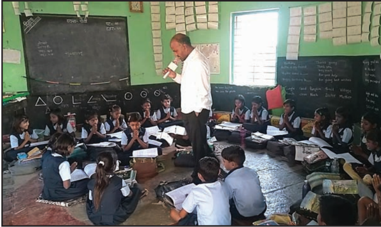
प्रत्येक दिवशी बदलणारी मुलांची बैठक व्यवस्था

शाळेतल्या इतर शिक्षकांनी सांगितले, “दोन वर्षांपूर्वी मुली शाळेचा अभ्यास वगळता शाळेत आयोजित केलेल्या कोणत्याही कार्यक्रमांमध्ये सहभागी होत नसत. गावकऱ्यांचा समावेश असलेल्या कार्यक्रमात मुख्य पाहुण्यांचे स्वागत करण्याची वेळ यायची तेव्हा मुलेच पुढे येऊन ते करत. कोणत्याही कृती किंवा चर्चेमध्ये मुलींचा सहभाग जवळपास नसायचाच. स्वतःची मते, स्वतःचे विचार व्यक्त करायला त्या घाबरत होत्या. त्याच वेळी मुलेही त्यांच्यापासून अंतर राखून असायची आणि मुलींना मदत करायचे नाहीत. त्यामुळे तसे पाहता शाळेमध्ये एक असमानतेचे वातावरण स्पष्टच दिसत होते.”