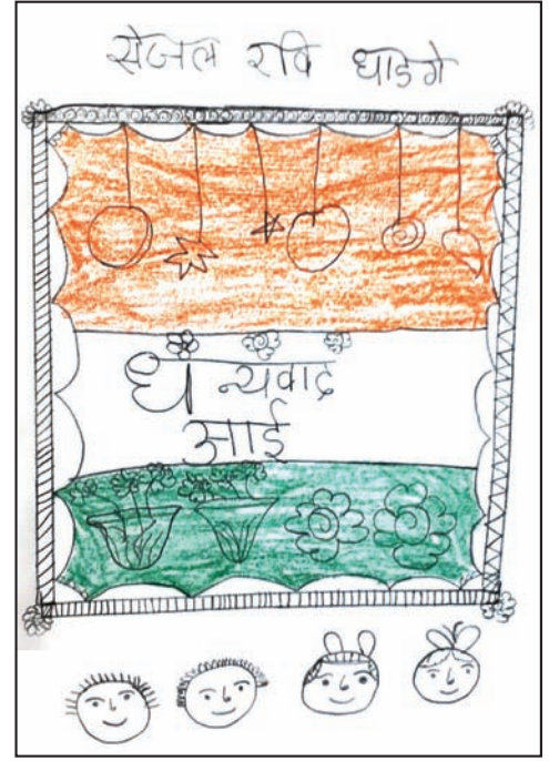
विद्यार्थिनीने 'धन्यवाद कार्डाच्या' माध्यमातून मानले आईचे आभार