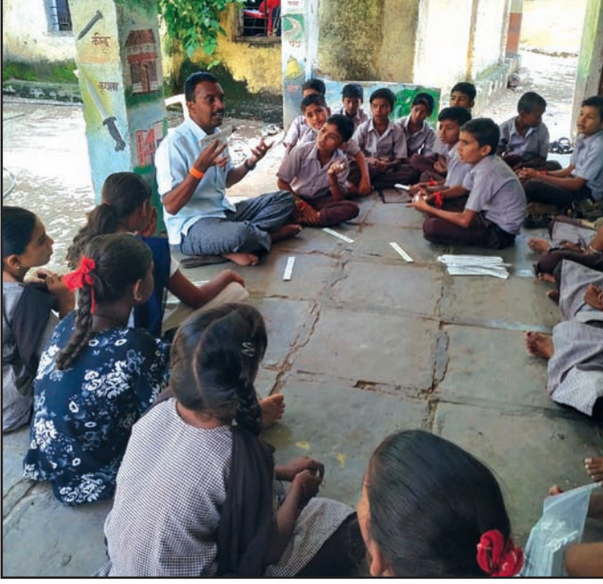
मूल्यवर्धन तासाला शिक्षकांशी चर्चा करताना मुले