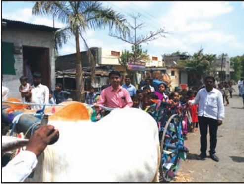
बैलगाडीतून विद्यार्थ्यांना शाळेत नेताना शिक्षक व ग्रामस्थ

मूल्यवर्धनच्या माध्यमातून जेव्हा विद्यार्थ्यांबरोबरच शिक्षक आणि पालकांमध्ये मैत्रीपूर्ण संबंध निर्माण झाले तेव्हा शाळेने 'आपापसात शिकू या' याला मोहिमेचे स्वरूप देऊन संपूर्ण गावाला याबरोबर जोडण्याचे ठरविले.