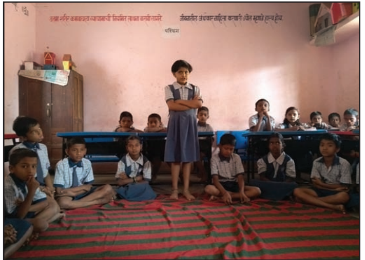
मूल्यवर्धन उपक्रमात स्वतःचे मत मांडताना विद्यार्थिनी