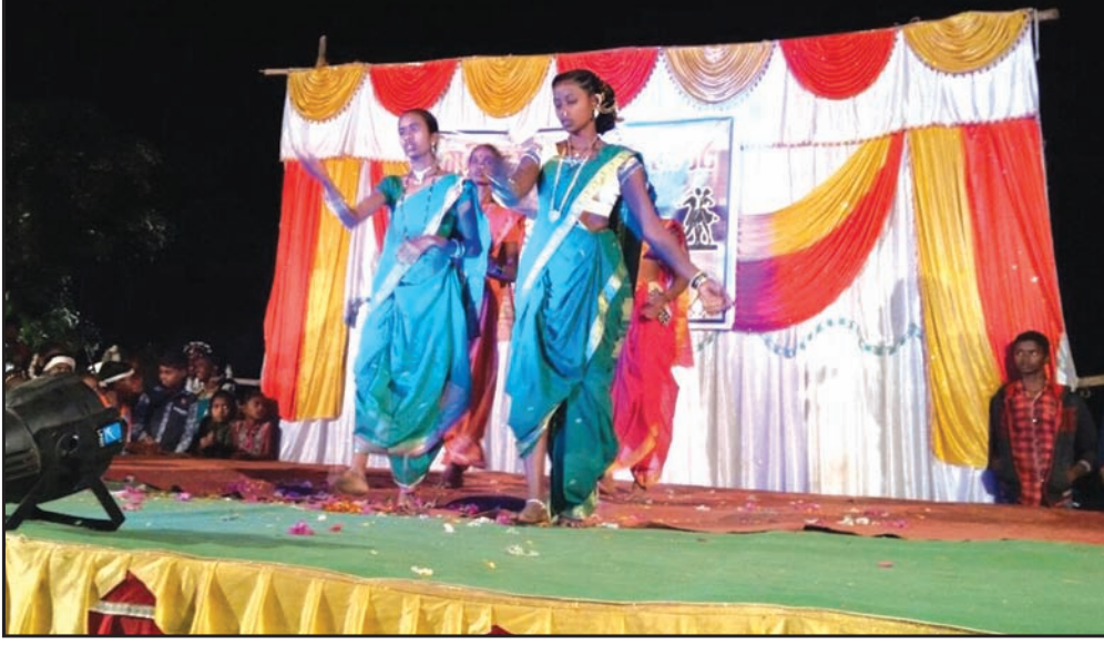
२६ जानेवारी रोजी झालेल्या सांस्कृतिक कार्यक्रमातील एक दृश्य