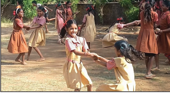
शाळेच्या मैदानात खेळात दंग झालेल्या मुली

भेटी घेऊन मुलींना शाळेत वेळेवर पाठविण्याची विनंती केली आणि पालकांनी ती मान्य केली. संधी मिळाल्यावर कठोर परिश्रम आणि सराव करून येथील मुलींनी गेल्या वर्षी तालुका स्तरावरील कबड्डी आणि पळण्याच्या शर्यतीत पहिला नंबर मिळविला. अशा प्रकारे त्यांनी गेल्या वर्षी तालुका स्तरावर आयोजित केलेल्या विज्ञान प्रदर्शनात प्रश्नोत्तरे आणि भाषण यामध्ये दुसरा नंबर मिळविला. याशिवाय गेल्या वर्षी आयोजित केलेल्या शिक्षण केंद्रस्तरावरील पारंपरिक नृत्यातही दुसरा नंबर मिळविला.