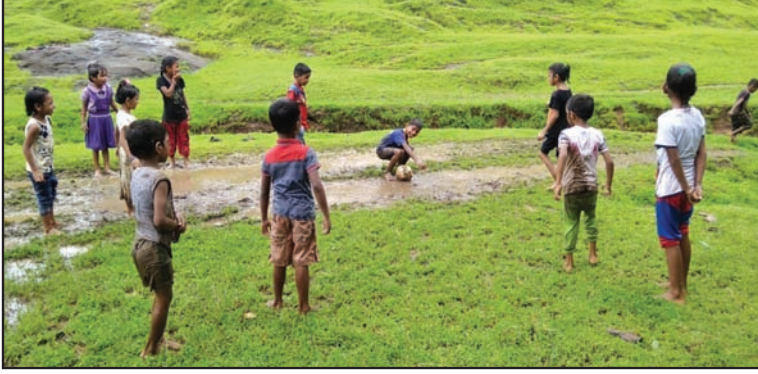
मूल्यवर्धनमधील काही उपक्रमांचे गावापासून दूर निर्जन ठिकाणी आयोजन

अशा चर्चेदरम्यान, जेव्हा कोणत्याही अपशकुनाचा उल्लेख होतो, तेव्हा शिक्षकांची भूमिका महत्त्वपूर्ण ठरते. बऱ्याचशा घटना केवळ योगायोगाने घडतात, त्यांचा मानवी जीवनावर कोणताही परिणाम होत नाही, यावर अधिकाधिक मुले सहमत होऊ शकतील अशा निष्कर्षापर्यंत चर्चा नेण्याचा प्रयत्न करावा.