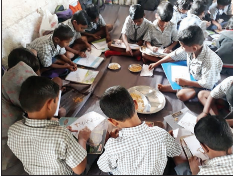
'थँक यू कार्ड' तयार करणारी मुले

औरंगाबाद तालुक्याच्या आणि जिल्ह्याच्या मुख्य ठिकाणापासून २० किलोमीटर अंतरावर असलेल्या लाठगांव या गावात जिल्हा परिषदेची प्राथमिक शाळा आहे. मूल्यवर्धनमुळे मुलांच्या वागण्यात दिसून आलेला बदल या शाळेचे वैशिष्ट्य बनले आहे. येथील शिक्षिकेने मूल्यवर्धनच्या तासाला करून घेतलेल्या कृती आणि चर्चेने मुले इतकी प्रभावित झाली आहेत की, मुले त्यांना मदत केलेल्या लोकांचे आभार मानू लागली आहेत. वर्षातील दोन-तीन प्रसंगी तर ही मुले या व्यक्तींसाठी स्वतःच्या हाताने 'थँक यू कार्ड' तयार करतात.