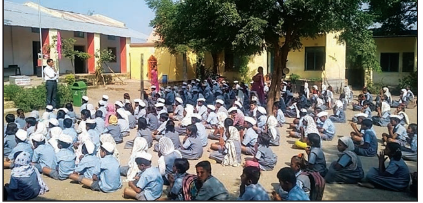
हिवरखेड गावातील प्राथमिक शाळेचा परिसर

प्रत्येक दिवशी प्रार्थना म्हणणारी काही मुले हा 'ऑनेस्टी बॉक्स' उघडून एकेक करून यातील वस्तू बाहेर काढतात आणि कोणती वस्तू शाळेतील कोणत्या मुलाची आहे, याची विचारणा करतात. त्यानंतर ती वस्तू ज्या मुलाची