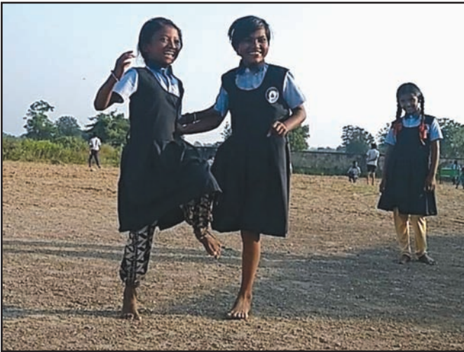
मैदानावरील खेळातून मुलींमध्ये नेतृत्व क्षमता वाढते