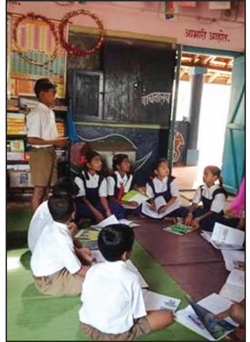
मूल्यवर्धन उपक्रमात तल्लीन झालेले विद्यार्थी