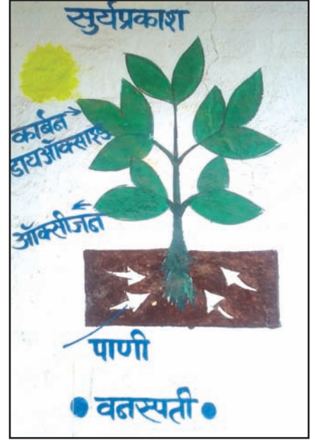
प्रकाश संश्लेषण प्रक्रिया स्पष्ट करणारी भिंतीवरील एक आकृती

१५ जून २०१८ मध्ये त्यांनी वृक्षारोपण अभियान राबविले होते. यामध्ये वरच्या इयत्तांतील ५० पेक्षा अधिक मुलांनी गावामध्ये कडुनिंब, चिंच, आंबा, वड आणि पिंपळ ही झाडे लावली होती, असेही त्यांनी सांगितले.