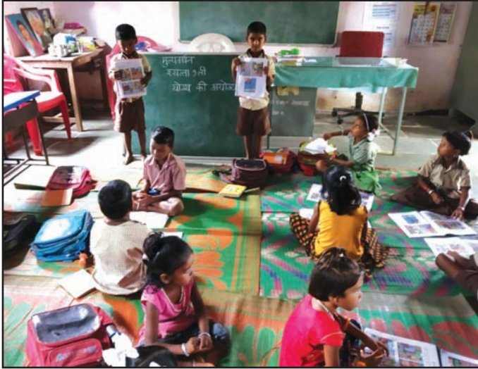
पहिलीच्या वर्गात मूल्यवर्धनचा उपक्रम