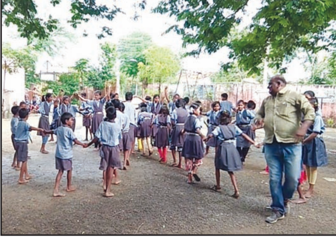
सहयोगी खेळाच्या माध्यमातून एकमेकांना मदत करताना मुले

खेळ एखाद्या विषयाच्या अभ्यासाच्या तासिका वापरूनही खेळले जातात. सहयोगी खेळाला जास्तीत जास्त दहा मिनिटे लागतात म्हणून ते सहजतेने आणि जास्त वेळ न घालविता खेळता येतात. बहुतेक सहयोगी खेळ मुलांना माहित असतात आणि ते फक्त आनंदाने या खेळांचा सराव करतात. प्रत्येक वर्गात मुलांची संख्या जास्त असल्याने सहयोगी खेळ साधारणपणे मैदानावर आयोजित केले जातात.’’