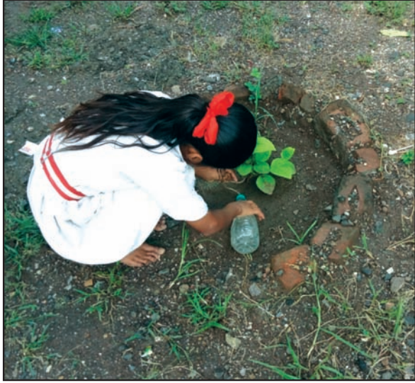
बाटलीतून थेंब थेंब पाणी झाडांच्या मुळांपर्यंत पोहोचविणारी एक मुलगी

असे. त्यामुळे अनेक वेळा त्या फांद्या तुटत असत, पण तो आता कोणत्याही प्रकारे झाडांचे नुकसान करीत नाही.