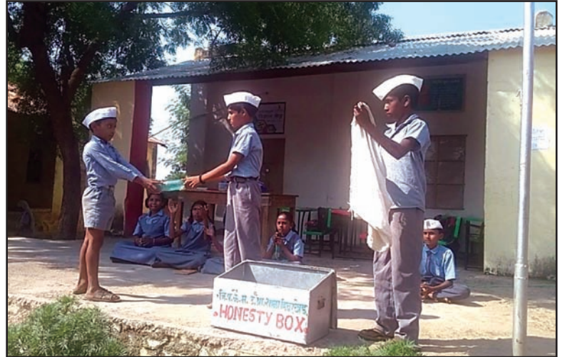
'ऑनेस्टी बॉक्स' मध्ये जमा झालेली वस्तू ज्या मुलाची आहे त्याला परत देण्यात येते.