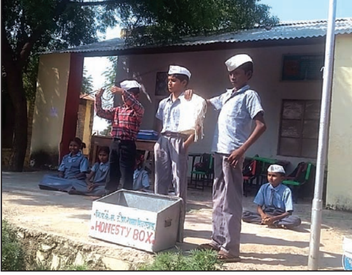
शाळेतील मुलांना मूल्यवर्धन उपक्रमातून समजले प्रामाणिकपणाचे महत्त्व

रुपये इतकी रोख रक्कम हे सारे 'ऑनेस्टी बॉक्स' मध्ये जमा केले आहे.