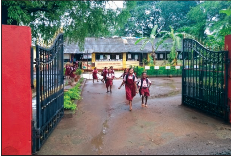
जिल्हा परिषद प्राथमिक शाळा शिलटे